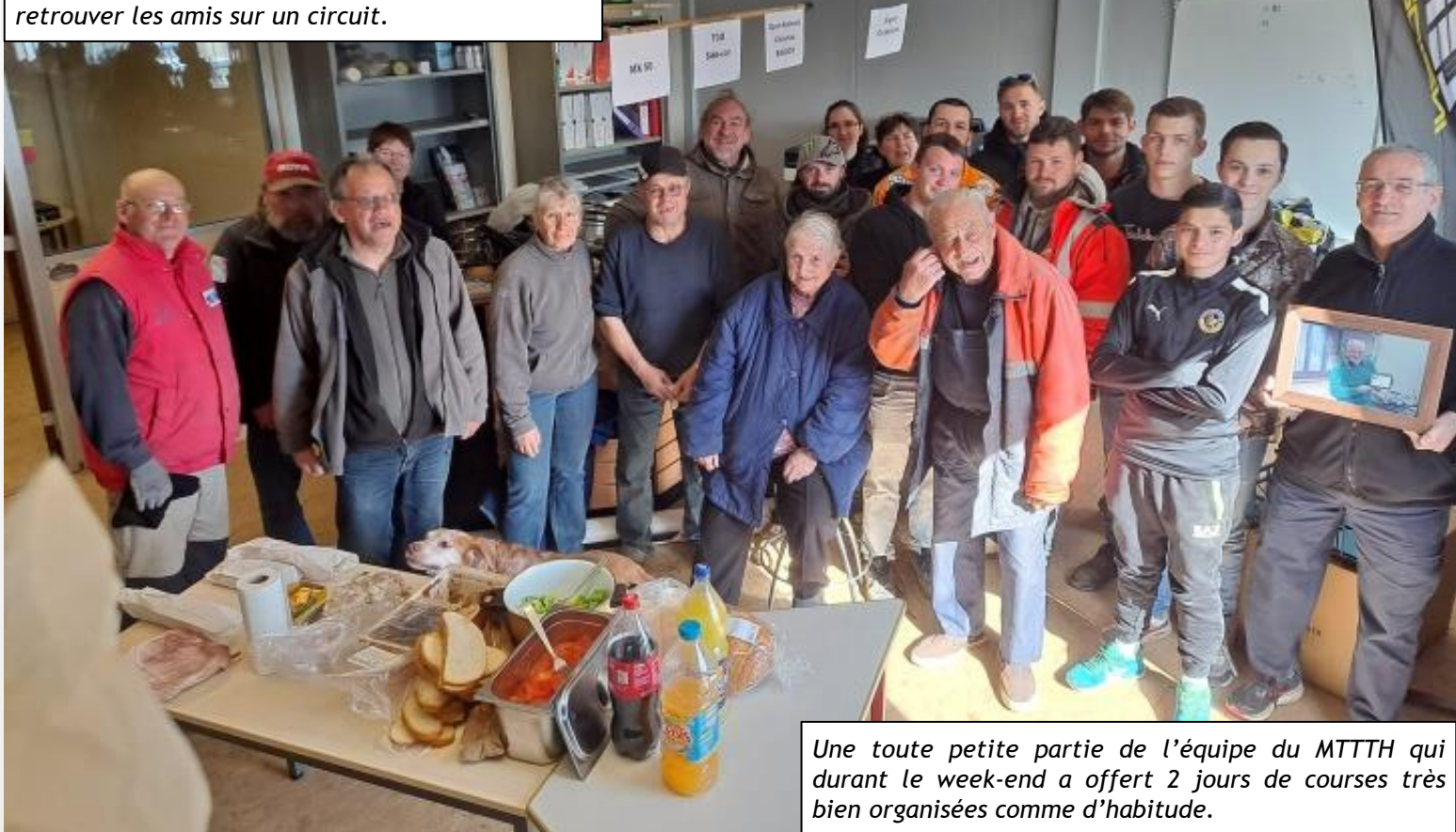
Une toute petite partie de l'équipe du MTTTH qui durant le week-end a offert 2 jours de courses très bien organisées comme d'habitude.